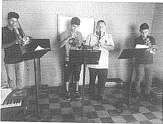
Lectura musical fase VI Actividad realizada el 03 de julio de 2018