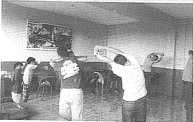
Arpeggio de Si bemol Actividad realizada el 10 de julio de 2018